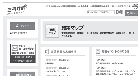
ミラサポ「施策マップ」のページ

探す手段としてもっとも効率的なのは、ウェブサイトである。補助金・助成金の公募は、基本的にインターネット上で発表される。事業系であれば、中小企業庁のサイト「ミラサポ」(www.mirasapo.jp)を検索することをお勧めする。ミラサポのトップページに「施策マップ」バナーがあり、それをクリックすると支援施策を確認できる。施策マップの特徴は、①絞り込み検索、②一覧表示、③比較表示、があり、支援内容、対象者、業種、募集時期、所在地などを選択すると、自社に合った施策をピンポイントで調べられる。